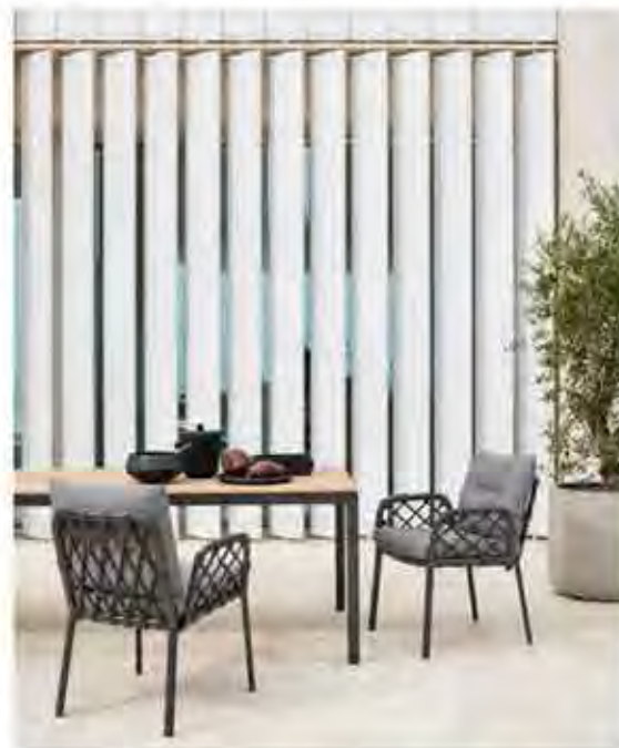
Der neue CARO Dining Sessel wird durch eine semi-transparente Seilflechtung charakterisiert.

Mit STAR präsentiert man erstmals eine Outdoor-Leuchte, die in Sachen Design und Beleuchtung spannende Akzente setzt. STAR gibt es als Stehlampe in Teak oder als tragbare Tischleuchte, wahlweise mit Teak oder mit Seil-Geflecht. Alle funktionieren mit Solarzellen, lassen sich aber auch über einen USB Adapter aufladen. Egal für welche Ausführung man sich entscheidet, STAR Leuchten erzeugen das perfekte Ambiente zu jeder solpuri Lounge oder Dining Kollektion und hüllen einen Wohnraum im Freien bei Einbrechen der Dämmerung in einen warmen Schein.