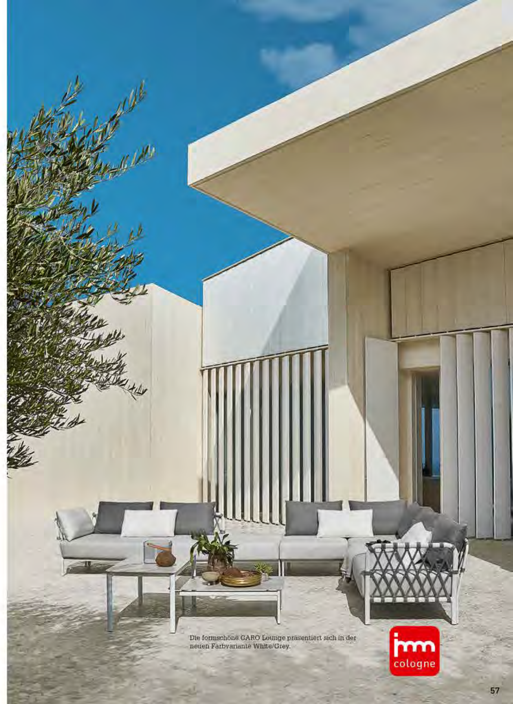
Die formschöne CARO Lounge präsentiert sich in der neuen Farbvariante White/Grey.