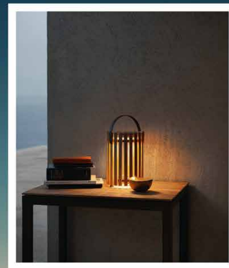
Mit STAR präsentiert solpuri erstmals eine Outdoor-Leuchte, die spannende und effektvolle Akzente setzt.

solpuri , der deutsche Hersteller und Designer hochwertiger Outdoor-Möbel, wird vom 13. bis 19. Januar 2020 sein Debüt auf der imm cologne in Köln geben.