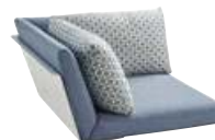
Top-Modul Ecke, inkl. Alu-Lehne Top Module Corner, incl. Alu Back Rest

V2 1 Sitz-Rücken-Polster + 1 Cocktail-Kissen 70 x 42 cm 1 Seat Back Cushion + 1 Cocktail-Cushion 70 x 42 cm