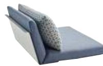
Top-Modul Sitz-Rücken, inkl. Alu-Lehne Top Module Seat-Back, incl. Alu Back Rest

Kissen-Varianten bei Top Modulen Cushion Versions of Top Modules