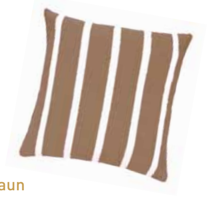
Von Petrol bis Braun

Text: Daniela de Cillia